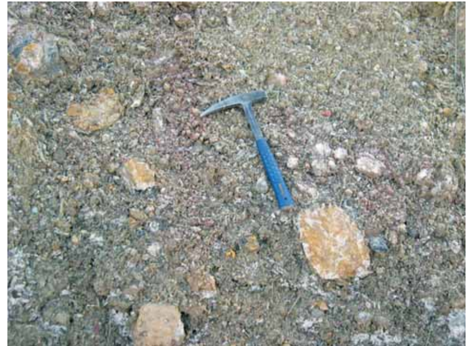
CI-LN F-20 Cantos y matriz en la Unidad Complejo de Yesos (unidad cartográfica 33)

Para ambas fotos N 37° 55' 45" W 1° 53' 13"