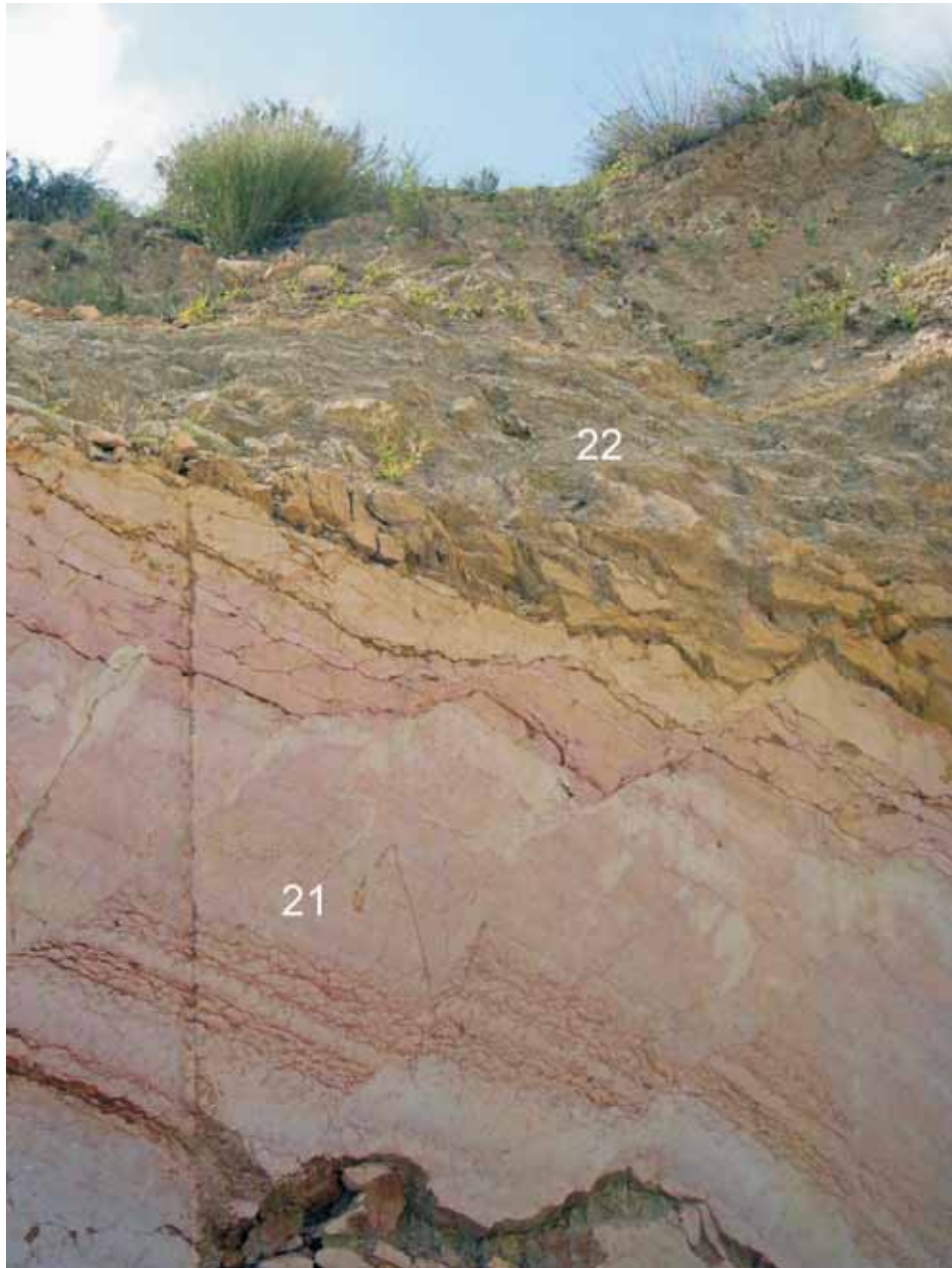
CI-LN F-7 N 37° 50' 12" W 1° 56' 46" Detalle de las calizas nodulosas de la unidad cartográfica 21 y de las calizas margosas y margas de la unidad cartográfica 22