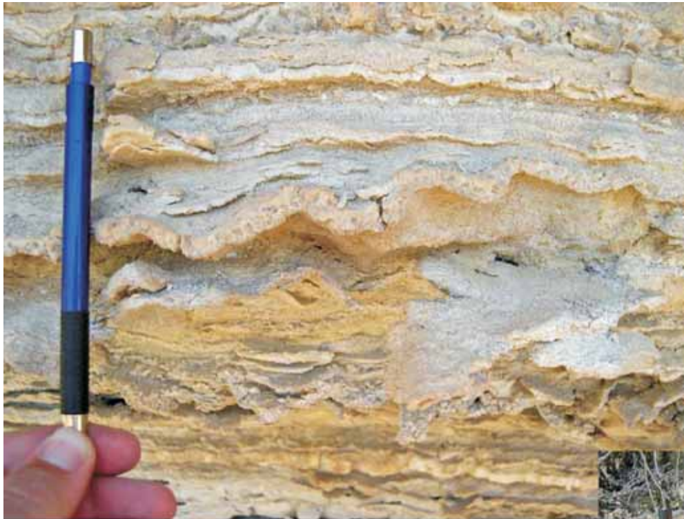
CI-LN F-23. Diferentes tipos de laminaciones en la unidad cartográfica 39 (Yesos de Campo Coy)

Para ambas fotos: N 37° 57' 4" W 1° 54' 46"